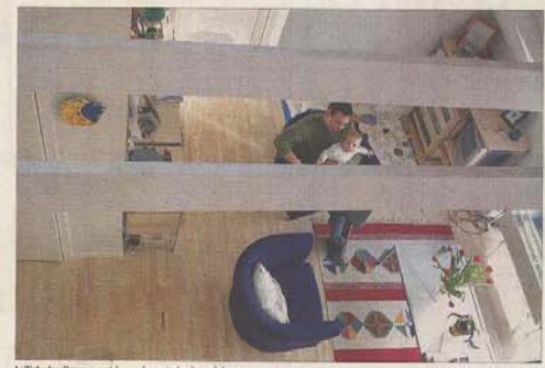
Lejligheden ligger oven i en nybygget vindfang på Amager.